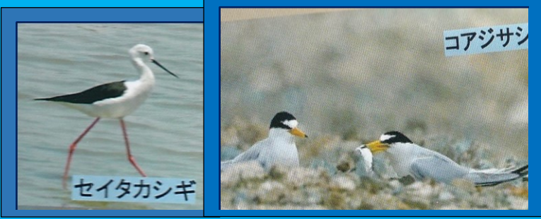
↑写真: 大阪自然環境保全協会の、「夢洲フォトアルバム」より